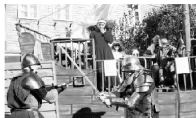
Blitzende Schwerter: Hautnah erleben die Zuschauer auf dem Piratenschiffen Kampf von King Artus, der das Burgfräulein befreien will, das der schwarze Ritter entführt hat.