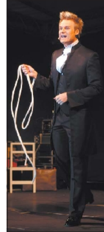
Zyculus hat moderiert und gezaubert.