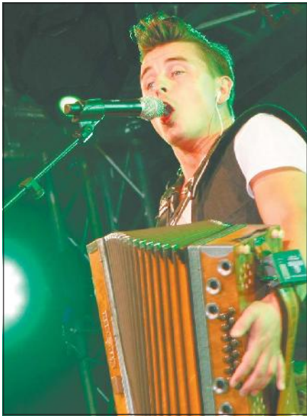
Der aufkommende Stern am österreichischen Schlagerhimmel: Andreas Gabalier.