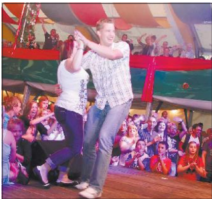
Wenn die Stimmung im Annenzelt auf ihrem Höhepunkt ist, entern die Fans die untere Bühne und tanzen selbst mit.