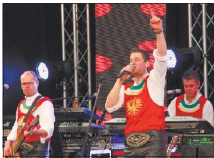
Originalgetreue Optik und tolle Live-Qualitäten: Die Schürzis beweisen nicht nur bei »Sierra madre« ihr Talent als Schürzenjäger-Coverband.