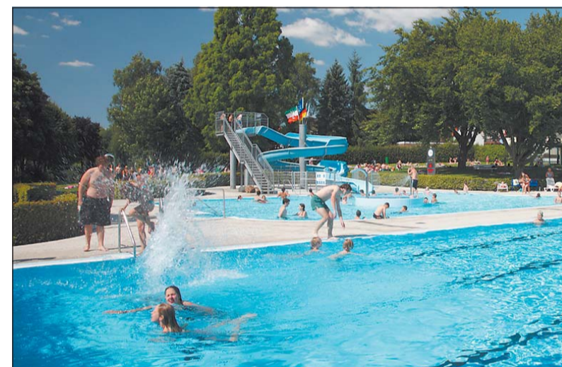
Im Sommerbad wird gleich an mehreren Stellen Energie gespart – unter anderem mit einer neu eingebauten Elektrolyseanlage, die zur Aufbereitung des Wassers dient.

»Inzwischen lebt jeder fünfte Einwohner Nordrhein-Westfalens in einer Kommune, die sich in besonderer Weise um Nachhaltigkeit bemüht. Der European Energy Award gilt heute als Mar-